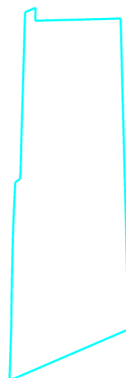
Projektētās teritorijas shēma pirms zemes ierīcības projekta izstrādes