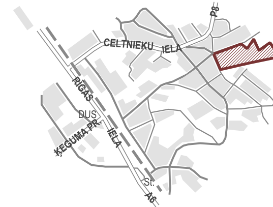
TERITORIJAS ATRAŠANĀS VIETA