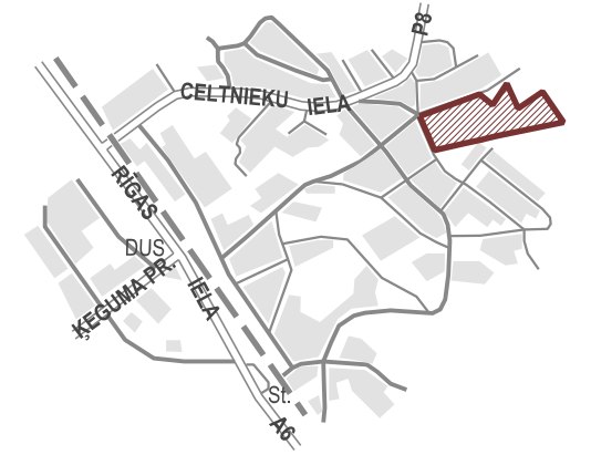
TERITORIJAS ATRAŠANĀS VIETA