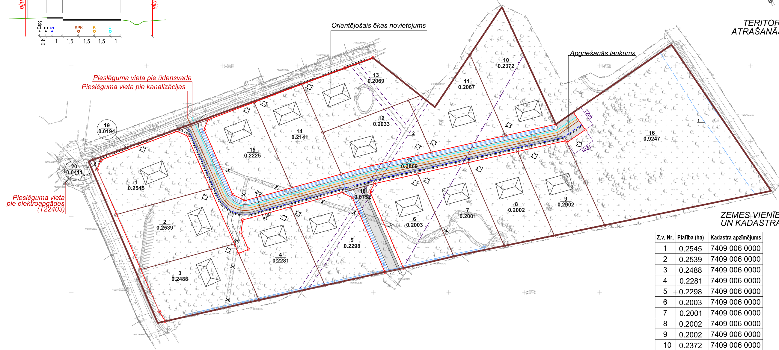
ZEMES VIENĪBU PLATĪBAS UN KADASTRA APZĪMĒJUMI